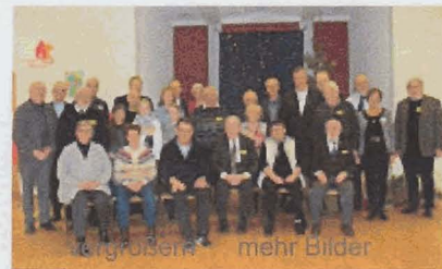
Die am Festtag anwesenden Mitglieder der SDG auf der Würzburger Marienhöhe.